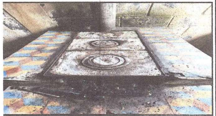
Foto 4: Plancha en mal estado, con mosaicos quebrados y chimenea de concreto con filtraciones de agua.